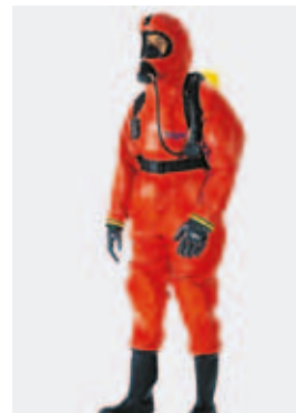
защита на цялото тяло