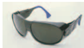
защита на очите и лицето

Примери за ЛЗРС за защита от химически риск: