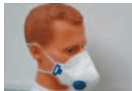
защита на дихателните пътища