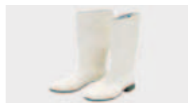
защита на краката